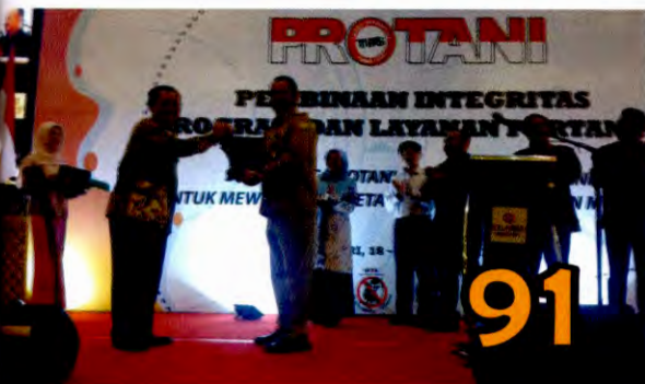
Pembinaan Protani Itjenta Sukseskan Kostratani